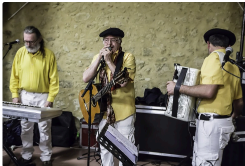
Irish Music lui succède