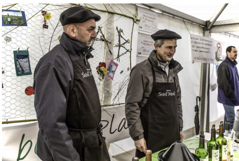
Le stand de vin bio à Saint-Mont