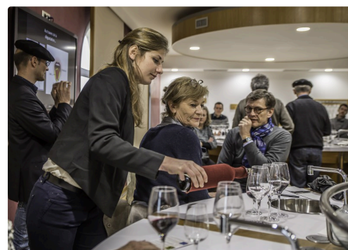
La dégustation va commencer