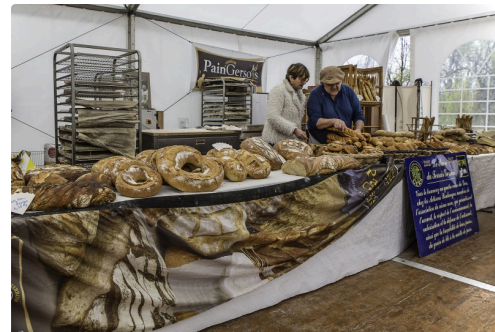
L'étal d'un boulanger à Saint-Mont