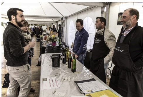
Clients sous les chapiteaux à Saint-Mont