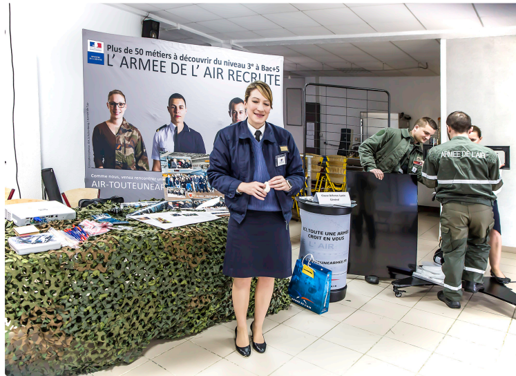
Nogaro – La Base de Mont-de-Marsan à la cité scolaire