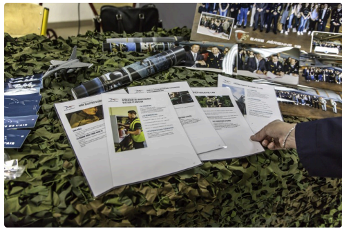
Des fiches claires sur les métiers de l'Armée de l'Air et des photos de la visite à la Base