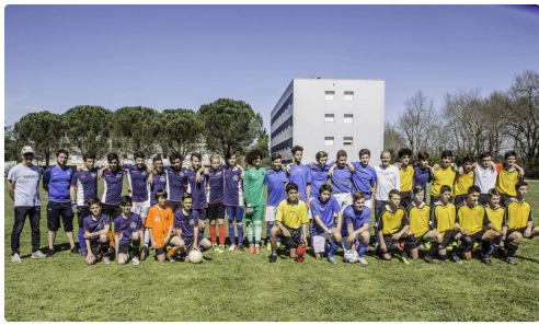
Les 3 équipes réunies avant les matchs