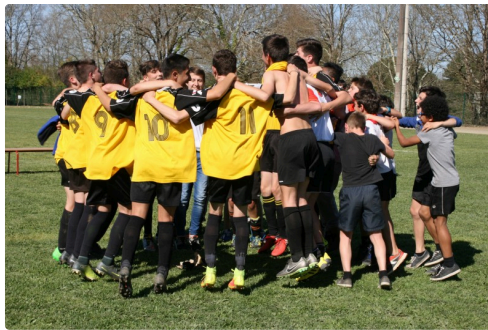
Regroupement de l'équipe de Nogaro