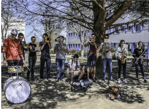
Une banda improvisée soutient l'équipe de Nogaro