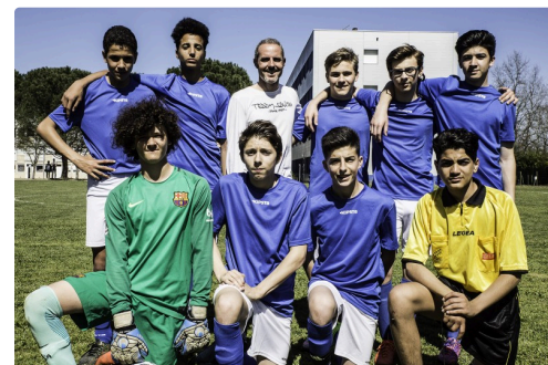
L’équipe de Nîmes avant les matchs