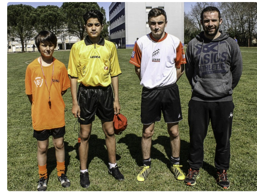
Les arbitres et un organisateur