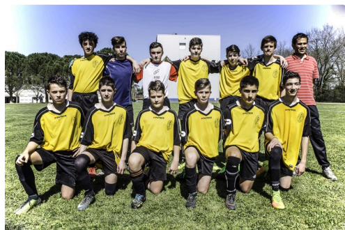
L’équipe de Nogaro avant les matchs