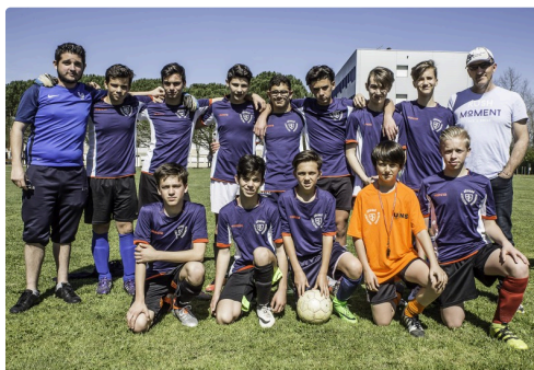
L’équipe de Narbonne avant les matchs