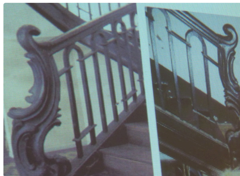
des rampes d'escaliers remarquables