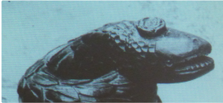
Marciac : une conférence sur les départs sculptés d'escaliers

une conférence illustrée de très belles photos