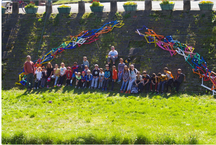
Centre de loisirs de Plaisance

La sculpture sur le thème de l'eau posée près du pont pour l'été