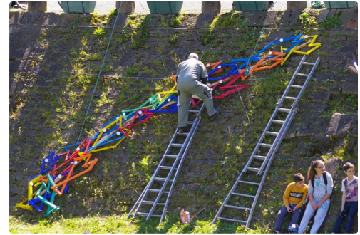
Dix photos Marcel Lavedan droits réservés pour le texte également , pas de copie sur Facebook autorisée