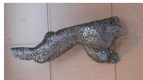
Sculpture de Denis Fourez.