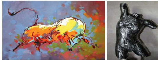
Auch : Peinture et sculpture font bon ménage