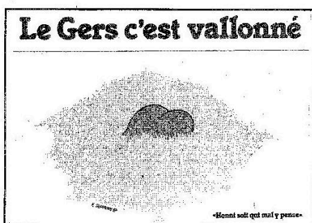
Une publicité de Marcel Sempéré qui en 1996 fit scandale.