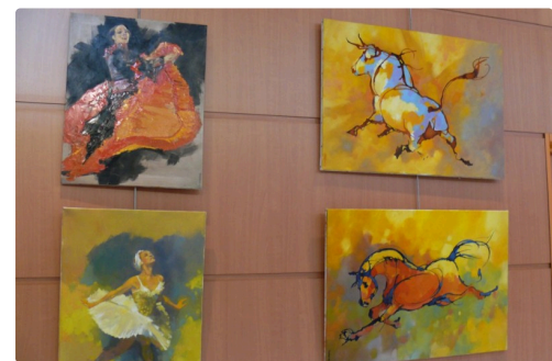
Toiles de Marcel Sempéré.