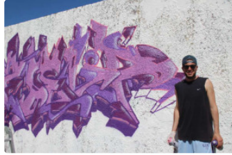
Eauze : La 3e édition Street'Art'Magnac

La 3e édition Street'Art'Magnac s'est déroulée du mercredi 5 avril au dimanche 9 avril. Cette fois-ci l'association ECLA, organisatrice de l'évènement, avait convié une vingtaine d'artistes qui ont pu exprimer tout leur talent sur les murs sélectionnés de la cité, ainsi que ceux des villages des alentours, notamment Dému, Lannepax, Maignan.