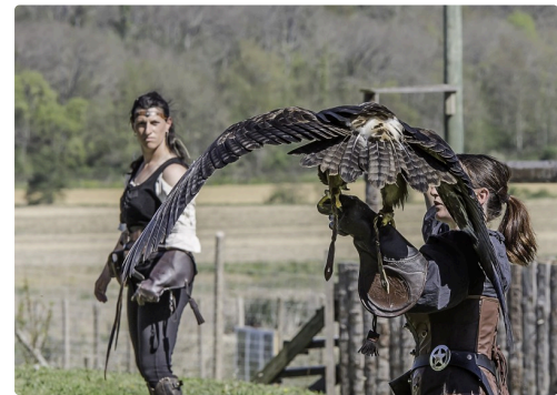
Laïka, aigle des steppes, de dos