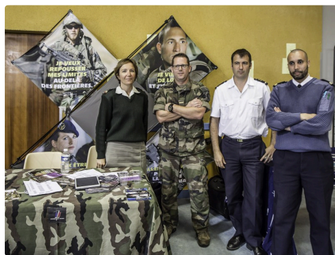
Le stand Armée de Terre et Marine nationale