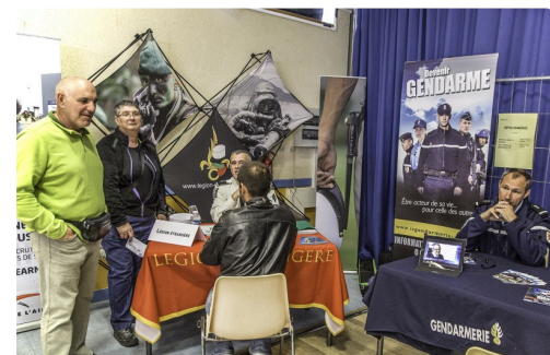
Stand de la Légion étrangère et stand de la Gendarmerie