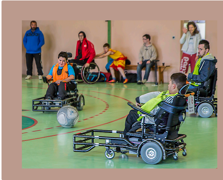
Laujuzan – Journée de sport en commun handi - valides