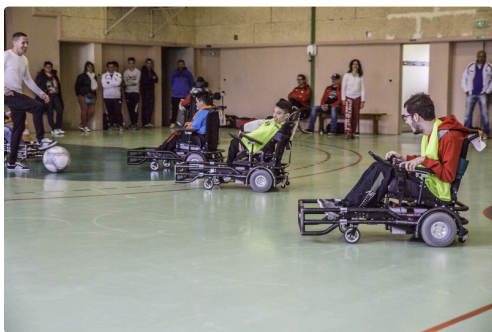
L'arbitre reprend la balle