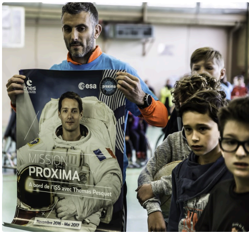
Affiche de la mission de Thomas Pesquet