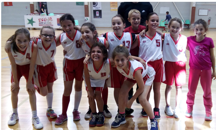
MIRANDE Basket Un tournoi Gilles Escudé

Le Basket Club Mirandais organise le 28 avril le premier tournoi Gilles Escudé destiné aux catégories poussines et poussins.