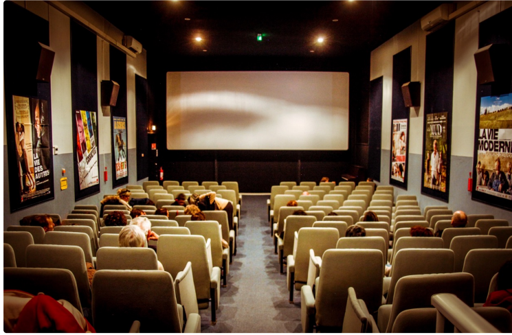
Cinéma l'Europe a Plaisance

Bonjour à tous, voici le programme et les nouveaux évènements. Tout d'abord demain soir une séance offerte par l'association Contact (qui lutte contre l'homophobie) en partenariat avec le collège de Plaisance: la projection du films « BOYS ». C'est gratuit pour tout le monde! L'association vous accueille à partir de 20h, et le film commencera à 20h30.