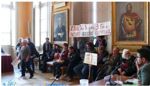
Le groupe des manifestants des Amis de la Terre et d'EAuch bien commun.