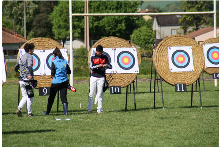
Villecomtal sur Arros, week-end gagnant

Du sport : rugby, tir à l'arc, ball-trap