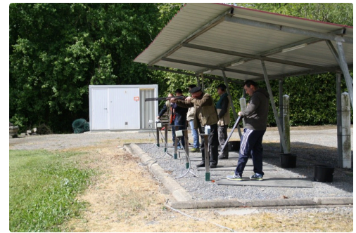
En action de tir.