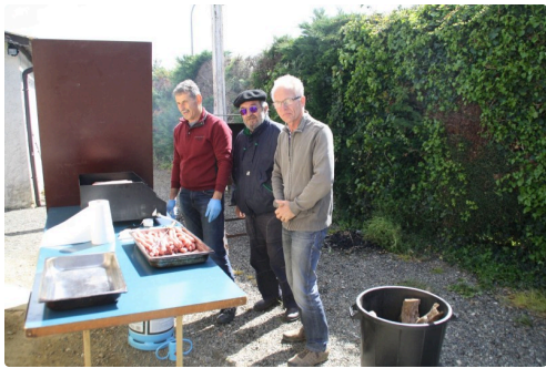
Les dirigeants du FIVA à la plancha.