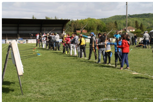
Archers en action.

D'autres challenges de ball-trap seront proposés le 29 juillet lors de la fête locale (16 heures à 2 heures du matin), puis le 13 août (toute la journée) et enfin le 9 décembre lors du Téléthon.