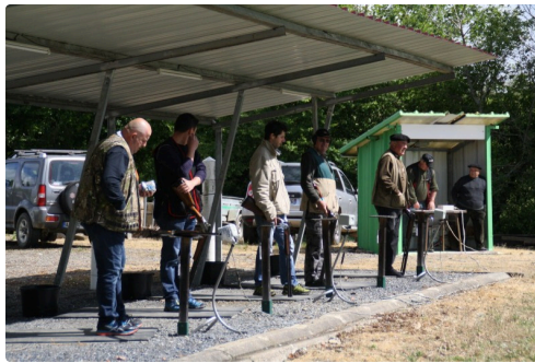
Le pas de tir