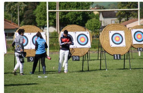
Comptabilisation des points.