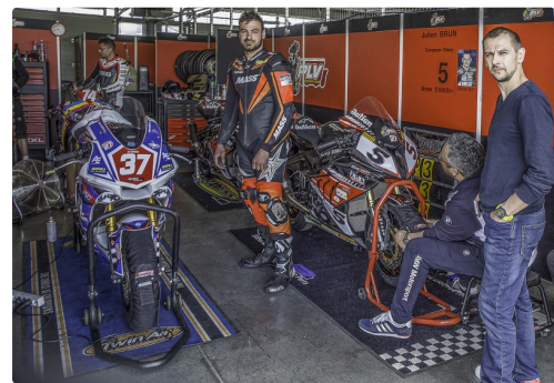
Chez PLV avec BMW