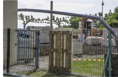
Le chantier de la cuisine, des sanitaires et de la cantine ont démarré