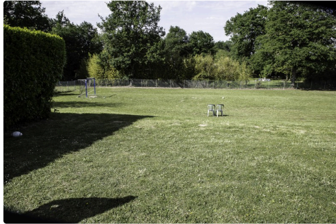
Le magnifique jardin de récréation attenant