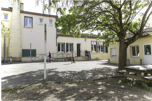
La cour de l'école