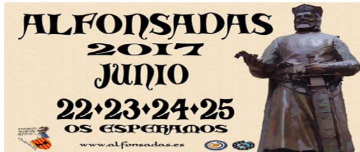
Allez voir les ALFONSADAS à CALATAYUD.