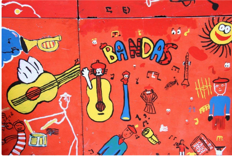
Bandas : des vitrines aux décors musicaux

Mobilisation de tous les enfants pour décorer la ville