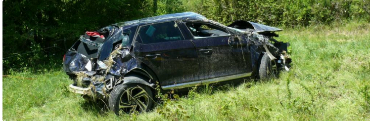
L'accident de voiture qui a fait un mort a été découvert 11 heures après sa survenue

Alors que l'orage grondait sur la ville d'Auch ce vendredi 12 mai à 0 h 30 et plus particulièrement du côté du chemin de Bedout à hauteur du 59 route de Vic, des riverains ont entendu un effroyable bruit mais ils l'ont mis sur le compte de l'orage. Il s'agissait en réalité d'un effroyable accident de voiture, une DS 5, lequel n'a été découvert qu'en matinée vers 11 h 30 par des riverains qui ont alerté les pompiers. Le conducteur âgé d'environ 35 ans, auscitain, chauffeur de taxi, qui a été éjecté de son véhicule est décédé.