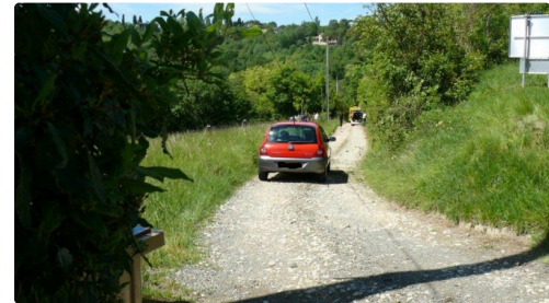
Le chemin fort pentu de Besout.