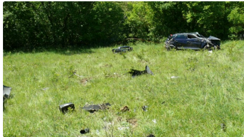
De nombreuses pièces jonchaient le sol.

Quant aux circonstances de l'accident qui semblerait liées à une vitesse excessive, l'homme aurait mordu sur la bordure qui marque le stop de l'ancienne route de Vic et la RD 924. Ayant perdu le contrôle de son véhicule celui s'est engagé sur le chemin fort pentu de Bedout en faisant de nombreux tonneaux sur une centaine de mètres.