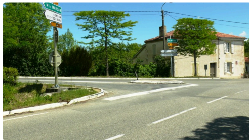
Le conducteur aurait perdu le contrôle de son véhicule à cet embranchement.