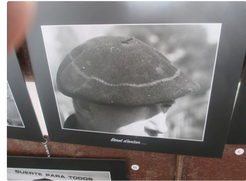
Le cercle de sueur représentant des années de travail