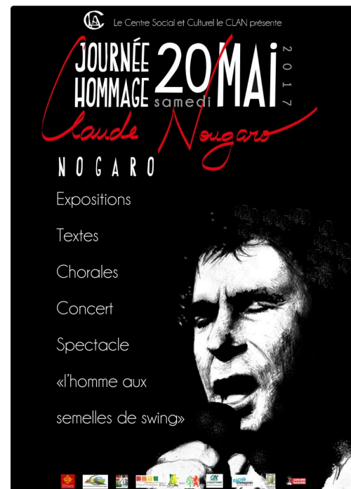
Affiche de l'hommage à Claude Nougaro