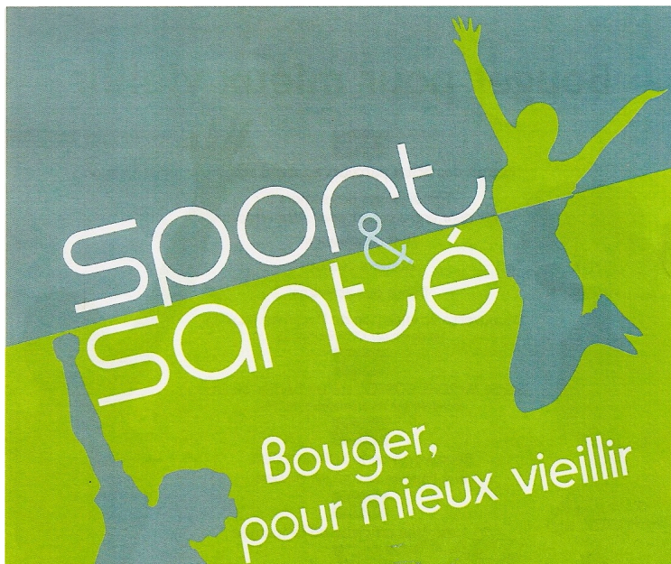
AUCH : 11ème édition Sport Santé