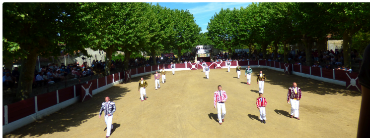
Tarsac en fête

La course landaise est l'attraction principale des fêtes de ce coquet et typique village de l'Adour.