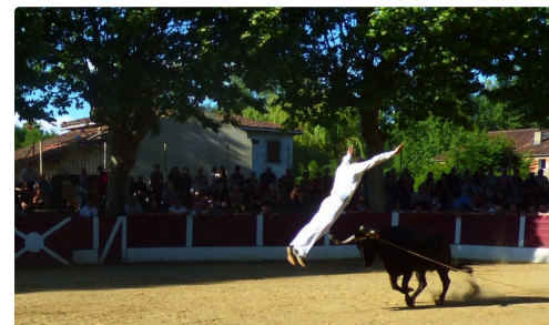
le départ d'un beau saut de l'ange