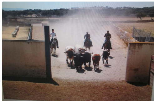
Rassemblement des toros avant l'embarquement

Cinco de la tarde .. au palco se lève un homme costumé et cravaté, il agite un mouchoir blanc, et tout s'agite dans le patio de toreros c'est le Président. Il a été choisi par le club parmi les aficionados dont on connaît les connaissances de la taumachie. En France pas de règlement officiel, on suit celui d'Espagne, pour s'y référer quand c'est favorable et l'ignorer lorsqu'il est gênant. Le président est le véritable patron de la corrida, il est accompagné de deux assesseurs avec lesquels il discutera lors des moments essentiels de la lidia, tercio de piques et attribution des trophées. Ce jury doit suivre avec attention l'action des picadors et décider le nombre de piques en fonction de la force du toro, bien analyser le comportement du toro sous les puyas, pour lui permettre d'être présent dans le tercio de muleta. L'après midi ne sera pas de tout repos, il faut compter aussi sur le public qui se veut être juge également. La panoplie du président est composée de 4 mouchoirs : un blanc pour diriger les changements de tercio et attribuer les récompenses, vert pour ordonner le retrait, rouge pour imposer la pose de banderilles à un toro qui refuse le combat et un bleu pour donner à la dépouille du toro un tour d'honneur pour les qualités exceptionnelles dans la lidia. L'attribution des oreilles est un moment fort pour les titulaires du palco, une, deux, aucune.