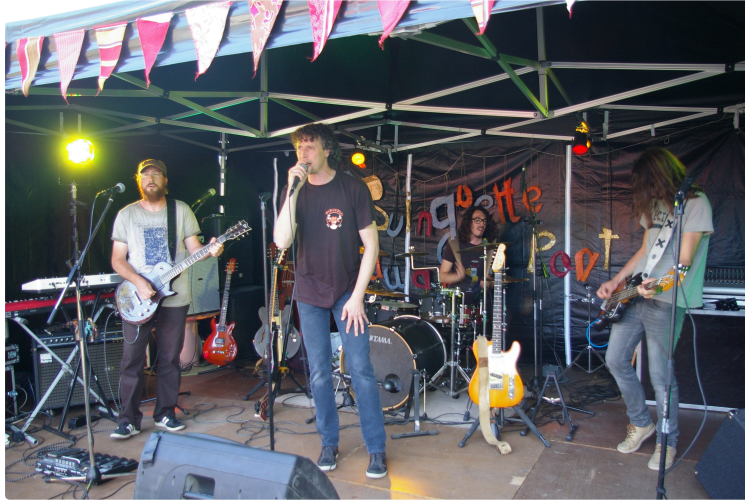
A Jû-Belloc la guinguette du "Petit Pont" ouvrait sa saison samedi

Une très grosse affluence pour cette reprise