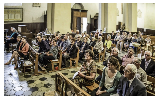
Autre vue de l'assemblée