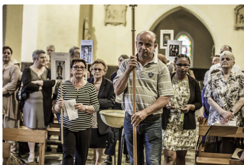
Le cortège avec les panonceaux des églises