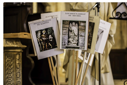
Les panonceaux sont rangés