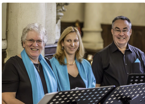
Le brain trust de la chorale

(1) La paroisse est composée des villages d'Aignan, Bouzon-Gellenave, Castelnavet, Fustérouau, Loussous-Débat, Margouët-Meymes et Sabazan. (2) Jean 17 1b-2a. (3) La vie éternelle, c'est qu'ils Te connaissent, Toi le seul vrai Dieu et celui que Tu as envoyé, Jésus-Christ ».