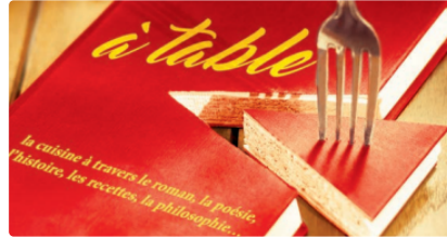
Lecture - Festival Rencontres en lecture

Le 3ème Festival Rencontres en Lectures aura lieu à Lectoure du 30 juin au 2 juillet, autour du thème : "A table!", la cuisine à travers le roman, la poésie, l'histoire, les recettes, la philosophie.