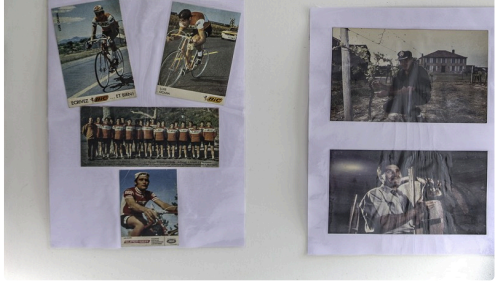
Panneau 1 de photos souvenirs