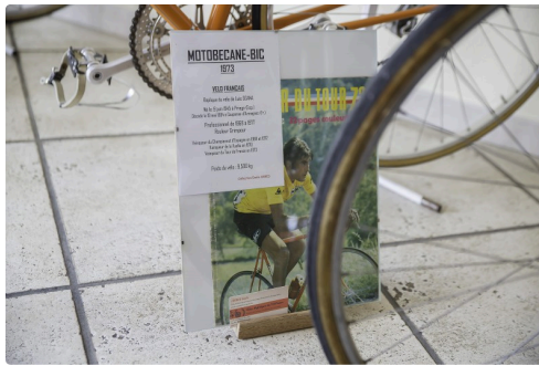
Vélo Motobécane-Bic réplique de celui de Luis Ocaña - Collection Emile Arbès Buzzy (64)