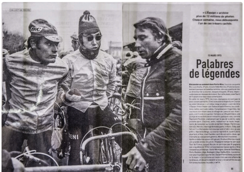
Eddy Merckx, Luis Ocaña et Jacques Anquetil lors d'un Paris-Nice éprouvant - Article de l'Equipe