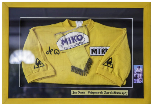
Maillot jaune 1973 de Luis Ocaña (la tache blanche à gauche est due à un reflet)