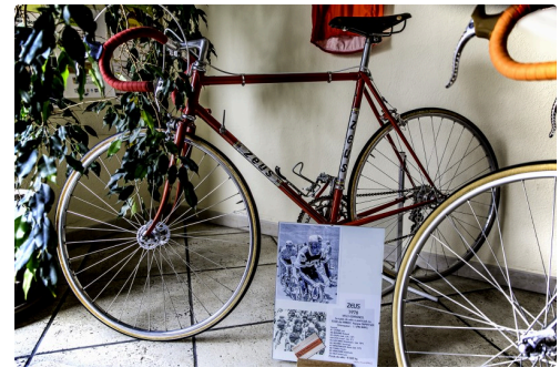
Vélo espagnol "Zeus" du type de celui que Luis Ocaña a utilisé au Tour de France 1976