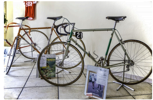
Dernier vélo utilisé en compétition par Luis Ocaña - Collection Emile Arbès Buzzy (64)