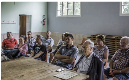
Autre vue de l'assistance