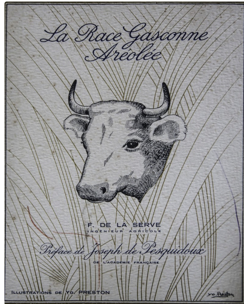
Couverture d'un ouvrage sur le boeuf aréolé (boeuf nacré de Gascogne ou race mirandaise) préfacé par Joseph de Pesquidoux, grand-père de Bertrand de Pesquidoux