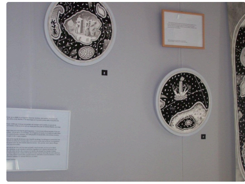
Des cartographies accompagnées de poèmes