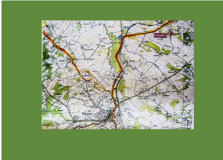
Nogaro – La Route-du-Sud finit à Nogaro le 18 juin (mis à jour le 10 juin)

Ce sera la 4e étape de cette grande course cycliste : entrée gratuite