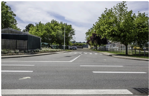
Accès de coureurs au circuit à leur 1er tour (le long de l'aérodrome, face à Bricomarché)

Description des parcours - Document communiqué par le maire de Nogaro