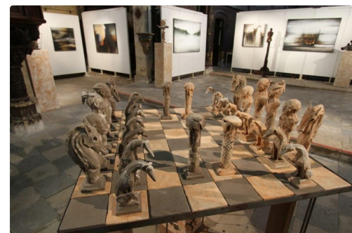
Gros plan sur l'échiquier.