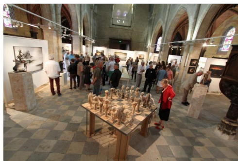
L'échiquier, est un condensé du talent de l'artiste. Photo : Jean-Marc Le Saux.