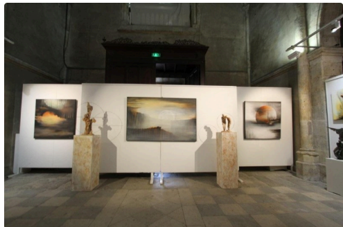
Chaque peinture de Jean-Jacques Lantourne est une quête de sérénité.