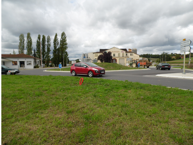
Giratoire de "Bonnet" à Lasserrade

Le projet d'animation publicitaire serait peut être relancé