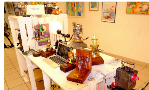
LE YAB LAB