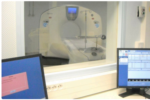
Le pupitre de commandes.