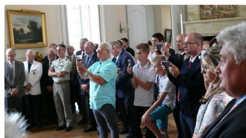
Les flashes ont crépité lors de la cérémonie.