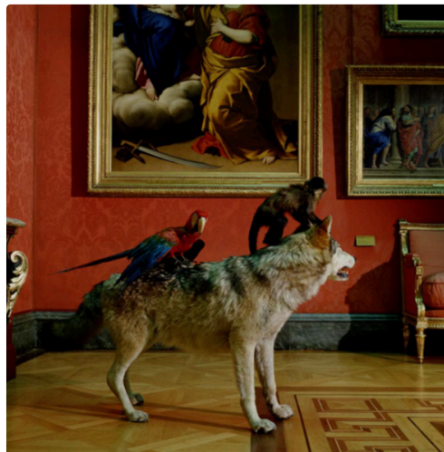
Karren Knorr : "High Art Life after the Deluge"