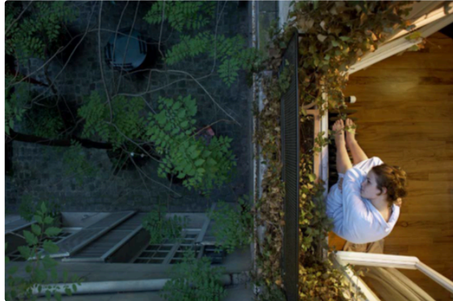
L'été photographique de Lecture 2017

Le Festival de la photographie de Lecture est devenu au fil des ans un incontournable des expositions estivales culturelles tant il a su s'imposer par sa qualité et son originalité.