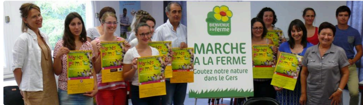
Les marchés à la ferme débutent le 1er juillet jusqu'au 24 août

Ce sont 28 marchés qui sont proposés aux gersois et aux touristes