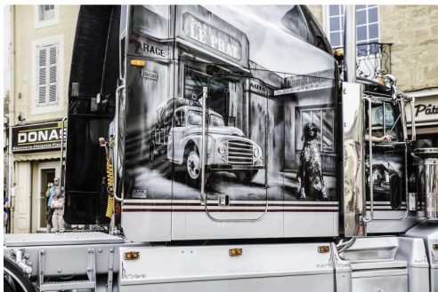
Le camion au chien