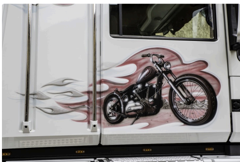
Une moto de secours ?