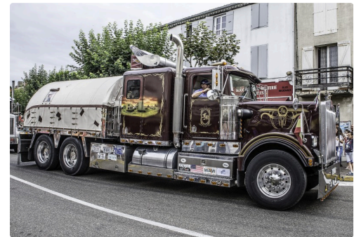
Le même de côté