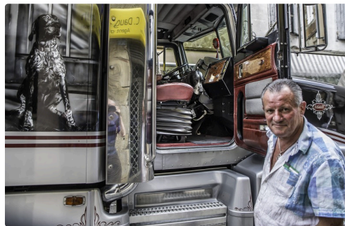
Et voici le chien dans la cabine, le maître et le portrait du chien