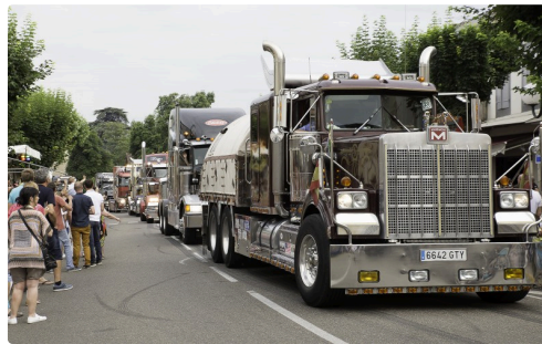
Marmon Motor Company construit au Texas jusqu'en 1997