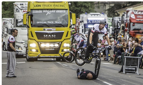
Préliminaires : acrobaties en moto

L'album ci-dessous donne une idée de la fête des camions et surtout, des routiers