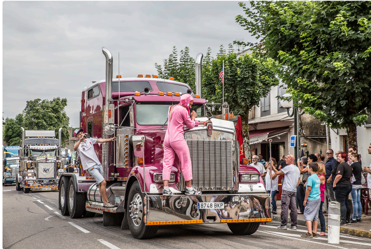
Nogaro – La parade des camions en ville

La parade des camions décorés est devenue une tradition à Nogaro pendant le week-end du Grand Prix Camion. Les épreuves de celui-ci avaient lieu cette année du 23 au 25 juin. Et, le soir du samedi 24, 215 monstres d'acier venus de toute la France (et quelques-uns de l'étranger) envahissent le centre-ville de Nogaro à grand bruit de klaxons et avec une débauche de phares. Puis ils se garent dans la rue Nationale, la rue d'Artagnan et l'avenue des Pyrénées.