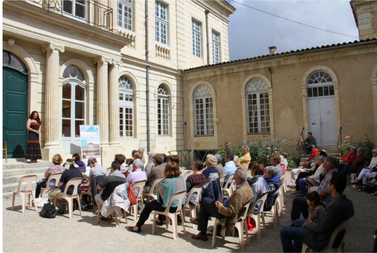
Musique en chemin

Dans le cadre de la saison de Musique en Chemin et en partenariat avec la ville de Condom, une quarantaine de spectateurs a pu assister ce dimanche à un concert autour des chants traditionnels bretons, dans la cour de l'Hôtel de Polignac classé aux monuments historiques et dont la restauration est soutenue par la Fondation du Patrimoine.