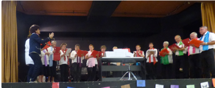
Marciac Le concert de fin d'année des Triolets

C'est à un bien bel après-midi que les Triolets de Pardiac avaient convié leurs amis marciacais.