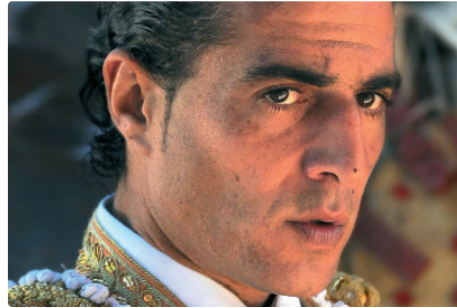
Taoumachie - Fandino à la une de la revue Toros

Gilles Cattiau, photographe pour la revue Toros, habitant le Gers et bien connu des aficionados, revient sur les conditions qui entourent la prise de vue du portrait de Fandino illustrant la Une du n° 2051 en date du 30 juin 2017.