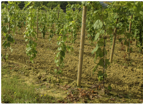
Parcelle d'à côté qui double les plants du conservatoire de Plaimont Producteurs