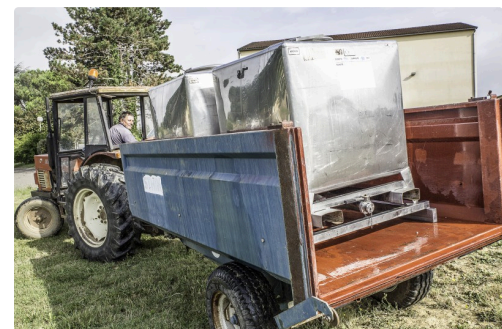
Apport d'eau pour la cuve de la machine à planter qui arrose aussi les plants