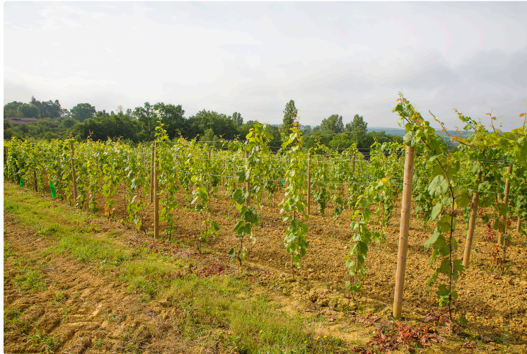
Aignan – Plaimont plante le vieux cépage manseng noir

Pour faire des rouges fins et de longue garde