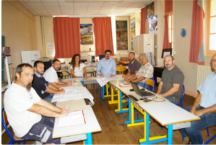
Réhabilitation de l'école Olléris de Plaisance

La première réunion de chantier avait lieu mardi matin