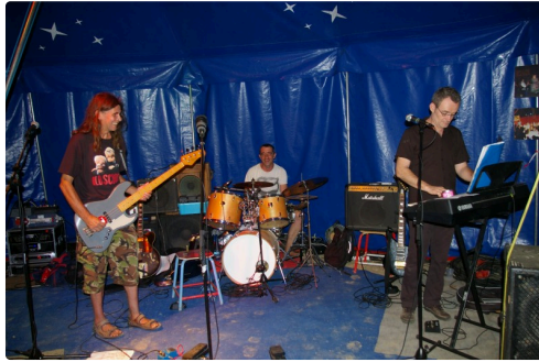
Des oreilles encore avec Gramou Vinaigrette : Douze