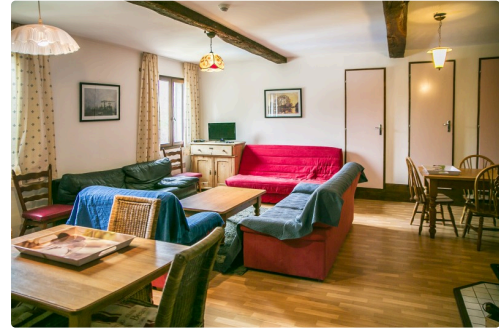
Le salon d'un des appartements