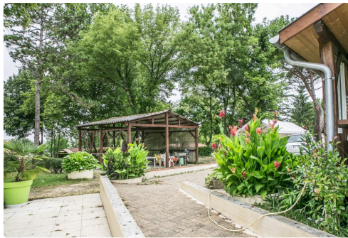
Vue de la salle à manger d'été