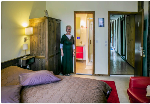
Une chambre d'appartement