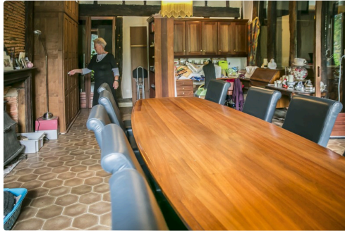
La salle à manger d'un appartement