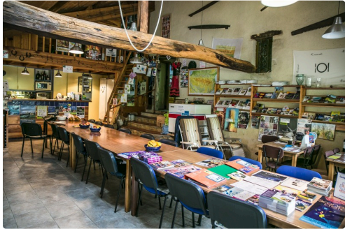
La Salle à manger principale avec le bar et la mezzanine