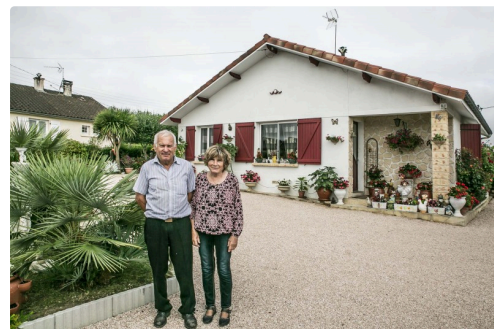
Maison et terrasse fleurie