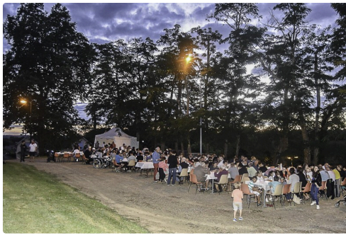
Le repas festif