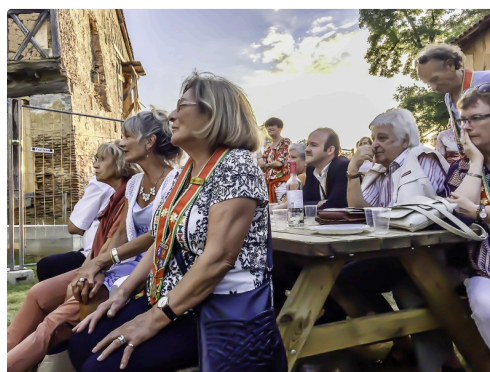
Dans l'assistance