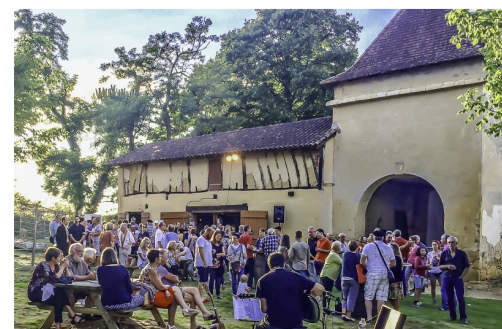
La fête devant le bâtiment annexe du Castet