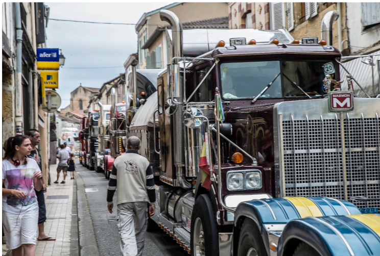
Nogaro – La rue Nationale devient rue de la République

Elle sera aménagée avec priorité aux piétons