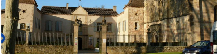
La dernière semaine de juillet à l'Abbaye de Flaran : Ateliers pour enfants et adolescents et balade sur le sentier de la Baïse

Il reste des places pour l'atelier BD et les Douces heures estivales : Pensez à vous inscrire